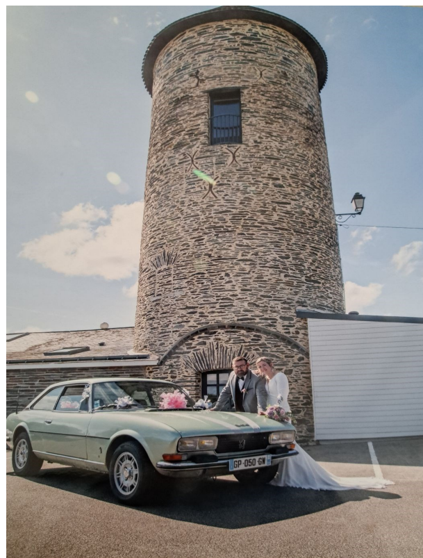
2 septembre 2023

N'apparaissent que les mariés qui ont donné leur accord