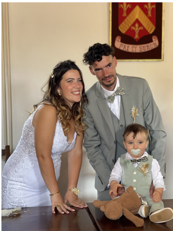
22 juillet 2023