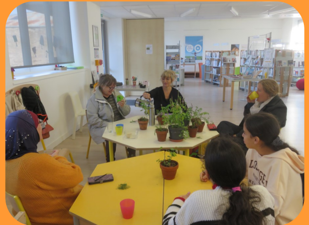
Initiation jardin aromatique – Dimanche 29 octobre