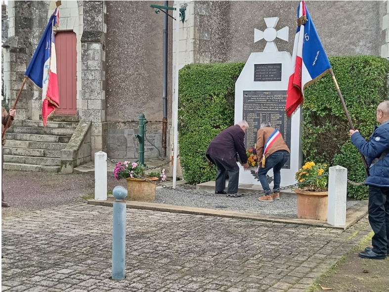
Gerbe réalisée par les membres de l'art floral

En association avec l'Union Nationale des Combattants et la population alverne, les élus municipaux ont célébré le 105ème anniversaire de l'Armistice de la guerre 14-18.