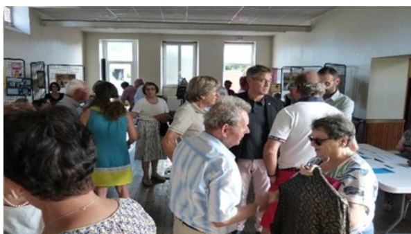
Portes ouvertes du 15/09/2023

Relais Accueil Proximité - Manoir de la Renaudière - 7, Rue Sophie Trébuchet 44670 PETIT AUVERNÉ