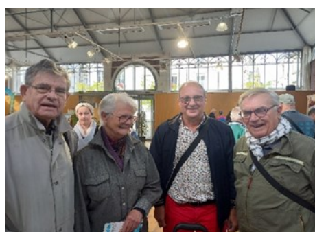
Les présidents qui se sont succédés