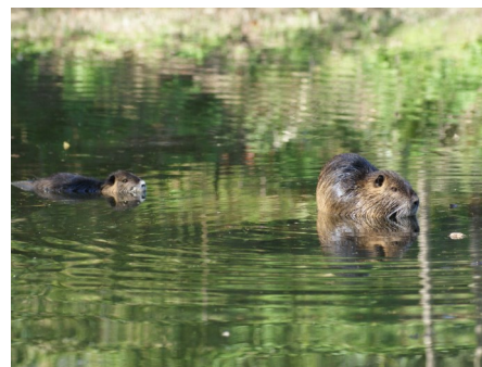
Ambroisie à feuilles d'armoise, cocons chenilles processionnaires et ragondins