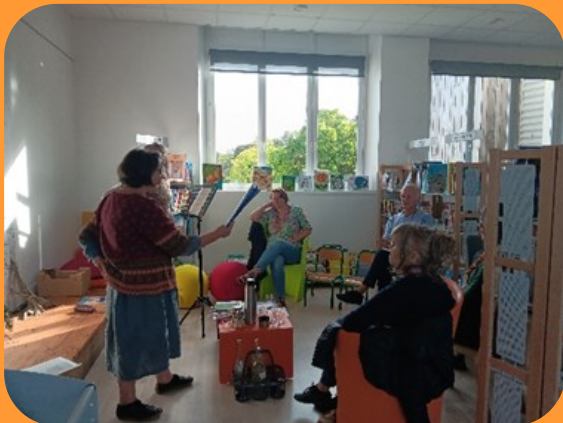
Lecture végétale – Dimanche 15 octobre

En octobre dernier dans le cadre de la fête des bibliothèques différents ateliers étaient proposés sur les 26 communes. Pour le Grand-Auverné, une lecture sur le thème du monde végétal ainsi qu'une initiation au jardin aromatique étaient proposées.