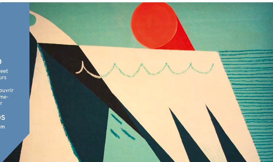
Sans titre (détail) - Pedro, 2020